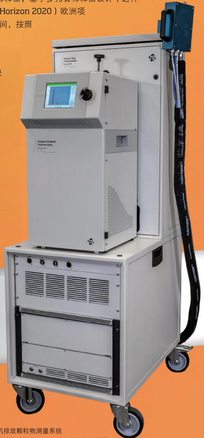
图 2. 3095 型发动机排放颗粒物测量系统 3090 型 EEPS 粒径谱仪和 3098 型多孔管热稀释器。

3090 型 EEPS 和 3098 型 PTT 组成了一套称为 3095 型发动机排放颗粒物测量系统的完整即用系统。这套易于使用、性能稳定的解决方案，是在颗粒物过滤器之前和 / 或之后测量原始发动机燃烧产生气溶胶的理想工具。